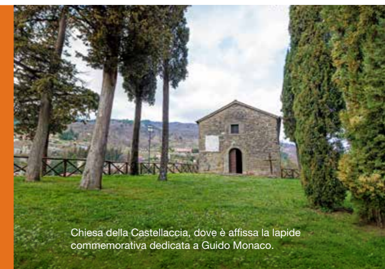
Chiesa della Castellaccia, dove è affissa la lapide commemorativa dedicata a Guido Monaco.